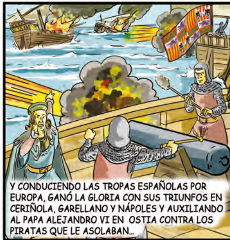
Y CONDUCIENDO LAS TROPAS ESPAÑOLAS POR EUROPA, GANÓ LA GLORIA CON SUS TRIUNFOS EN CERIÑOLA, GARELLANO Y NÁPOLES Y AUXILIANDO AL PAPA ALEJANDRO VI EN OSTIA CONTRA LOS PIRATAS QUE LE ASOLABAN...