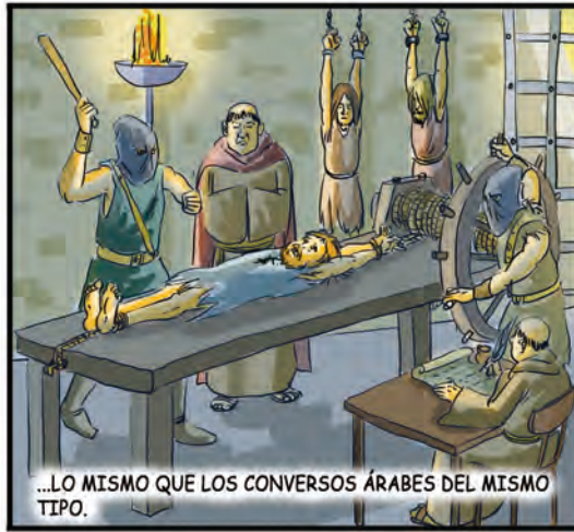
...LO MISMO QUE LOS CONVERSOS ÁRABES DEL MISMO TIPO.