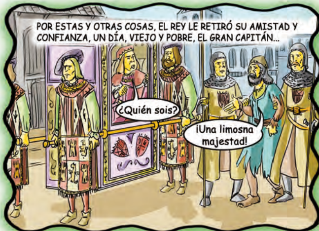
POR ESTAS Y OTRAS COSAS, EL REY LE RETIRÓ SU AMISTAD Y CONFIANZA, UN DÍA, VIEJO Y POBRE, EL GRAN CAPITÁN...

... "en picos, palas y azadones para enterrar los enemigos muertos, cien millones..en campanas rotas de tanto repicar victorias nuestras, 160.000 ducados, en..."