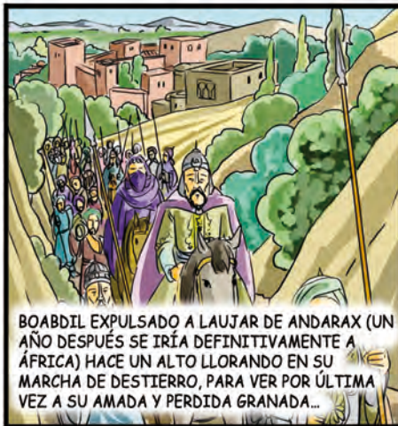
BOABDIL EXPULSADO A LAUJAR DE ANDARAX (UN AÑO DESPUÉS SE IRÍA DEFINITIVAMENTE A ÁFRICA) HACE UN ALTO LLORANDO EN SU MARCHA DE DESTIERRO, PARA VER POR ÚLTIMA VEZ A SU AMADA Y PERDIDA GRANADA...