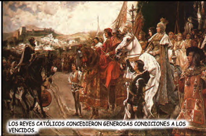
LOS REYES CATÓLICOS CONCEDIERON GENEROSAS CONDICIONES A LOS VENCIDOS...

MESES ANTES, EL 2 DE ENERO DE 1492, BOABDIL CONTRA EL DESEO DE SUS SÚBDITOS VE IMPOSIBLE RESISTIR MÁS Y CAPITULA, ASÍ TERMINAN CASI 800 AÑOS DE DOMINIO ÁRABE EN AL ANDALUS.