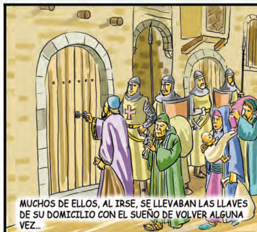
MUCHOS DE ELLOS, AL IRSE, SE LLEVABAN LAS LLAVES DE SU DOMICILIO CON EL SUEÑO DE VOLVER ALGUNA VEZ...

LA INQUISICIÓN ERA INFLEXIBLE; CREADO EL PRIMER TRIBUNAL EN SEVILLA EN 1480. LE SIGUIERON LOS DE CÓRDOBA (1482) Y JAÉN (1483). HABÍA SIDO AUTORIZADA EN ESPAÑA POR EL PAPA SIXTO IV, A PROPUESTA DE LOS REYES CATÓLICOS EN 1478. SE SUPRIMIRÍA FINALMENTE EL AÑO DE 1843.