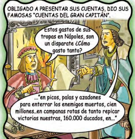
OBLIGADO A PRESENTAR SUS CUENTAS, DIO SUS FAMOSAS "CUENTAS DEL GRAN CAPITÁN".

Estos gastos de sus tropas en Nápoles, son un disparate ¿Cómo gasto tanto?