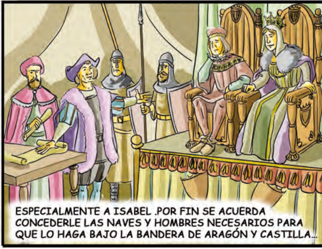
ESPECIALMENTE A ISABEL .POR FIN SE ACUERDA CONCEDERLE LAS NAVES Y HOMBRES NECESARIOS PARA QUE LO HAGA BAJO LA BANDERA DE ARAGÓN Y CASTILLA...