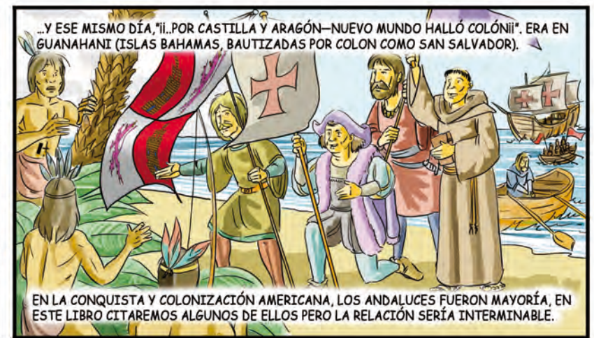
...Y ESE MISMO DÍA, "¡¡POR CASTILLA Y ARAGÓN-NUEVO MUNDO HALLÓ COLÓN!". ERA EN GUANAHANI (ISLAS BAHAMAS, BAUTIZADAS POR COLON COMO SAN SALVADOR).