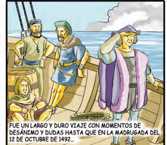
FUE UN LARGO Y DURO VIAJE CON MOMENTOS DE DESÁNIMO Y DUDAS HASTA QUE EN LA MADRUGADA DEL 12 DE OCTUBRE DE 1492...