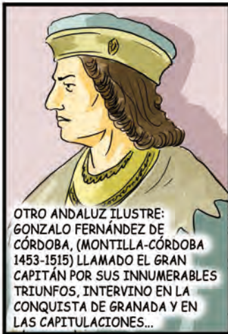
OTRO ANDALUZ ILUSTRE: GONZALO FERNÁNDEZ DE CÓRDOBA, (MONTILLA-CÓRDOBA 1453-1515) LLAMADO EL GRAN CAPITÁN POR SUS INNUMERABLES TRIUNFOS, INTERVIENE EN LA CONQUISTA DE GRANADA Y EN LAS CAPITULACIONES...

RECORDEMOS QUE A LOS MORISCOS SE LES HABÍA GARANTIZADO SEGURIDAD Y POSESIONES, PERO LA REALIDAD FUE OTRA :SE COMENZÓ PROHIBIÉNDOLES USAR LA LENGUA ALJAMÍA (ANDALUZ Y CASTELLANO) E INCLUSO SE LES PROHIBIÓ DUCHARSE(ii)...