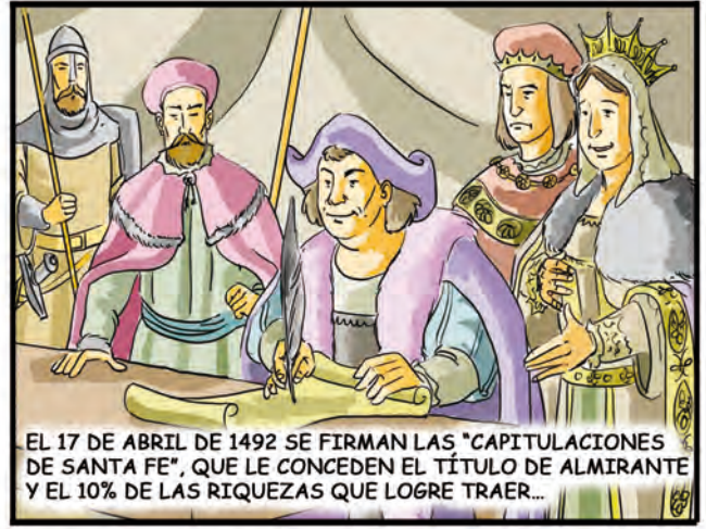
EL 17 DE ABRIL DE 1492 SE FIRMAN LAS "CAPITULACIONES DE SANTA FE", QUE LE CONCEDEN EL TÍTULO DE ALMIRANTE Y EL 10% DE LAS RIQUEZAS QUE LOGRE TRAER...

EL DÍA 3 DE AGOSTO DE 1492 SALIERON TRES CARABELAS DE PALOS DE LA FRONTERA (HUELVA) RUMBO A LO DESCONOCIDO. UN VIAJE EN EL QUE ANDALUCÍA TUVO GRAN PRESENCIA E IMPORTANCIA: EN EL MONASTERIO DE LA RÁBIDA (TAMBIÉN HUELVA) FUE PROTEGIDO COLÓN A SU LLEGADA A ESPAÑA Y SI COLÓN CAPITANEABA LA NAO SANTA MARÍA, LOS HERMANOS PINZÓN, (NACIDOS EN PALOS) LE AYUDARON CON HOMBRES Y DINERO.