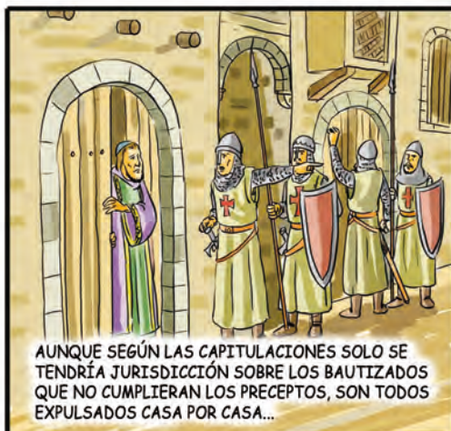
AUNQUE SEGÚN LAS CAPITULACIONES SOLO SE TENDRÍA JURISDICCIÓN SOBRE LOS BAUTIZADOS QUE NO CUMPLIERAN LOS PRECEPTOS, SON TODOS EXPULSADOS CASA POR CASA...

LA PERSECUCIÓN A LOS JUDÍOS ES CRUEL, ESE MISMO AÑO SE DECRETA SU EXPULSIÓN QUE SERÍA IGUALMENTE DECRETADA EN POCO TIEMPO, EN LOS REINOS DE PORTUGAL Y GRANADA.