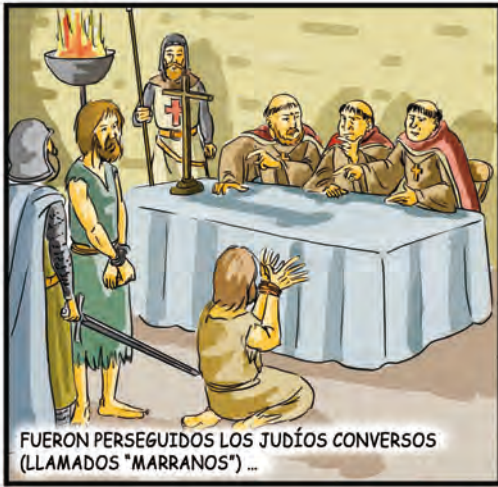
FUERON PERSEGUIDOS LOS JUDÍOS CONVERSOS (LLAMADOS "MARRANOS") ...