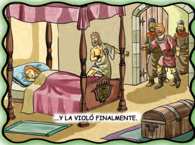
...Y LA VIOLÓ FINALMENTE.