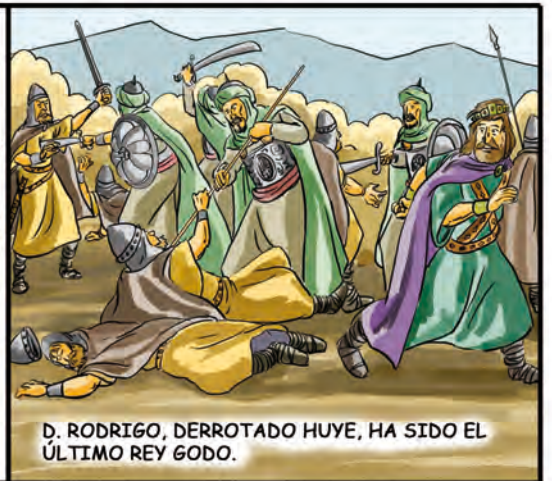
D. RODRIGO, DERROTADO HUYE, HA SIDO EL ÚLTIMO REY GODO.

LOS MUSULMANES COMIENZAN ASÍ LA INVASIÓN DE LA PENÍNSULA, PRIMERO POR LAS TIERRAS QUE ELLOS LLAMAN "AL ANDALUS", DE DONDE VIENE EL NOMBRE ACTUAL DE ANDALUCÍA.