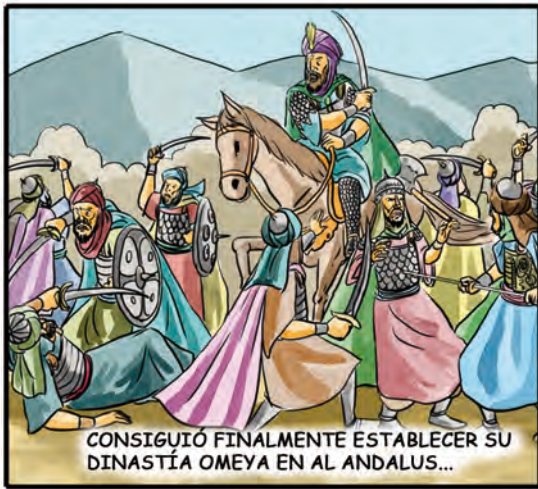
CONSIGUIÓ FINALMENTE ESTABLECER SU DINASTÍA OMEYA EN AL ANDALUS...