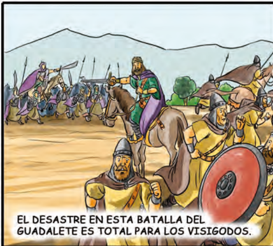
EL DESASTRE EN ESTA BATALLA DEL GUADELETE ES TOTAL PARA LOS VISIGODOS.

LOS MUSULMANES COMIENZAN ASÍ LA INVASIÓN DE LA PENÍNSULA, PRIMERO POR LAS TIERRAS QUE ELLOS LLAMAN "AL ANDALUS", DE DONDE VIENE EL NOMBRE ACTUAL DE ANDALUCÍA.