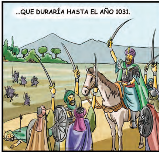
...QUE DURARÍA HASTA EL AÑO 1031.