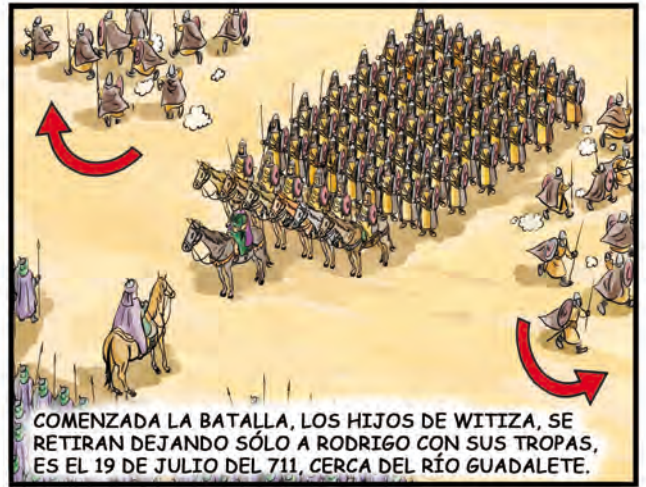
COMENZADA LA BATALLA, LOS HIJOS DE WITIZA, SE RETIRAN DEJANDO SÓLO A RODRIGO CON SUS TROPAS, ES EL 19 DE JULIO DEL 711, CERCA DEL RÍO GUADELETE.