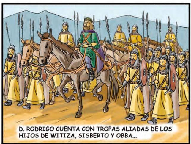
D. RODRIGO CUENTA CON TROPAS ALIADAS DE LOS HIJOS DE WITIZA, SISBERTO Y OBBA...

¡Reuniré mis tropas para hacerles frente!