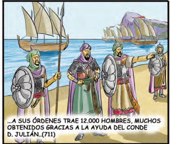
...A SUS ÓRDENES TRAE 12.000 HOMBRES, MUCHOS OBTENIDOS GRACIAS A LA AYUDA DEL CONDE D. JULIÁN..(711)