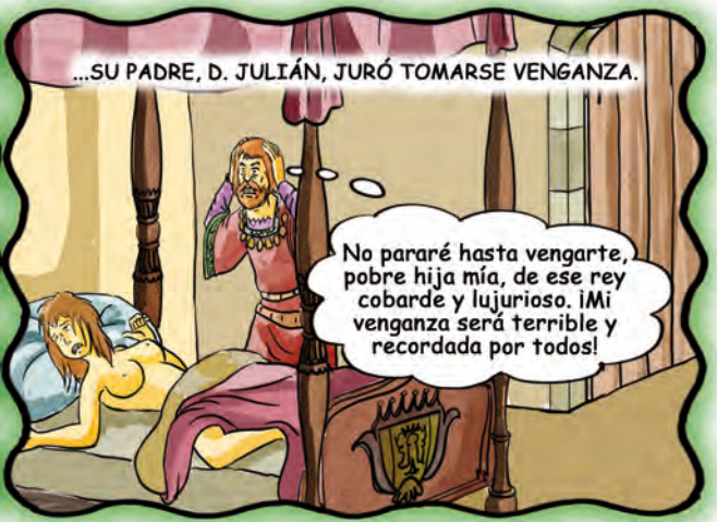
...SU PADRE, D. JULIÁN, JURÓ TOMARSE VENGANZA.

No pararé hasta vengarte, pobre hija mía, de ese rey cobarde y lujurioso. ¡Mi venganza será terrible y recordada por todos!