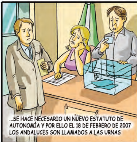
...SE HACE NECESARIO UN NUEVO ESTATUTO DE AUTONOMÍA Y POR ELLO EL 18 DE FEBRERO DE 2007 LOS ANDALUCES SON LLAMADOS A LAS URNAS