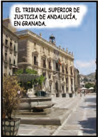
EL TRIBUNAL SUPERIOR DE JUSTICIA DE ANDALUCÍA, EN GRANADA.