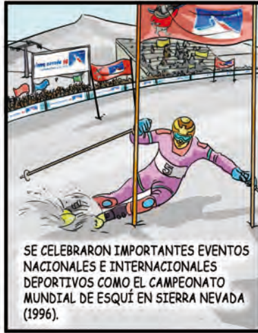
SE CELEBRARON IMPORTANTES EVENTOS NACIONALES E INTERNACIONALES DEPORTIVOS COMO EL CAMPEONATO MUNDIAL DE ESQUÍ EN SIERRA NEVADA (1996).

LA ESPERANZA DE VIDA EN NUESTRA AUTONOMÍA LLEGA A SER DE 82,1 PARA MUJERES Y 75,6 PARA HOMBRES. LA MORTALIDAD SEGÚN DATOS DE 1985 A 2005 DESCENDE EN UN 61,3. EL CRECIMIENTO ECONÓMICO ES DEL 150,10 CUANDO EL EUROPEO SE FIJA EN UN 69,2. EL EMPLEO CRECE EN UN 100% O SEA EL CUÁDRUPLE DE LA COMUNIDAD EUROPEA Y EL 24,3 POR ENCIMA DE LA MEDIA ESPAÑOLA.