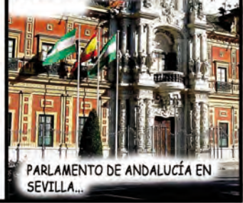
PARLAMENTO DE ANDALUCÍA EN SEVILLA...

LAS CLAVES DEL AUTOGOBIERNO ANDALUZ, SE CENTRAN EN EL PODER EJECUTIVO QUE EMANA DEL CONSEJO DE GOBIERNO, EL PODER LEGISLATIVO, CORRESPONDIENTE AL PARLAMENTO ANDALUZ, Y EL PODER JUDICIAL, ATRIBUIDO AL TRIBUNAL SUPERIOR DE JUSTICIA DE ANDALUCÍA.