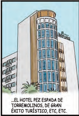
...EL HOTEL PEZ ESPADA DE TORREMOLINOS, DE GRAN ÉXITO TURÍSTICO, ETC, ETC.