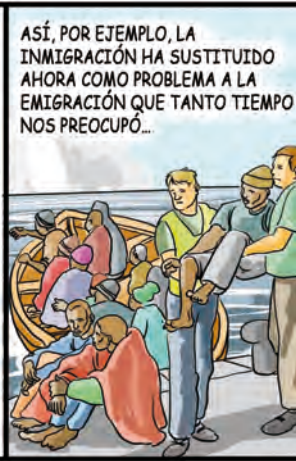
ASÍ, POR EJEMPLO, LA INMIGRACIÓN HA SUSTITUIDO AHORA COMO PROBLEMA A LA EMIGRACIÓN QUE TANTO TIEMPO NOS PREOCUPÓ...