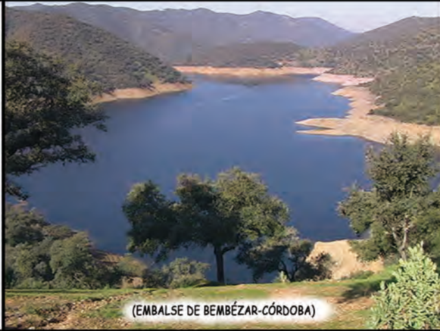
(EMBALSE DE BEMBÉZAR-CÓRDOBA)

Y CON SUS 3255 HECTÓMETROS CÚBICOS AL AÑO (58 POR CIENTO DEL AGUA NECESARIA PARA TODA ANDALUCÍA), 55 EMBALSES Y 115 CENTRALES HIDROELÉCTRICAS, ANDALUCÍA PIDE SUS COMPETENCIAS, PARA EL APROVECHAMIENTO HIDRÁULICO DE LAS AGUAS DE SU CUENCA.