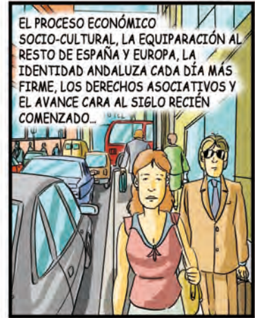
EL PROCESO ECONÓMICO SOCIO-CULTURAL, LA EQUIPARACIÓN AL RESTO DE ESPAÑA Y EUROPA, LA IDENTIDAD ANDALUZA CADA DÍA MÁS FIRME, LOS DERECHOS ASOCIATIVOS Y EL AVANCE CARA AL SIGLO RECIENTE COMENZADO...