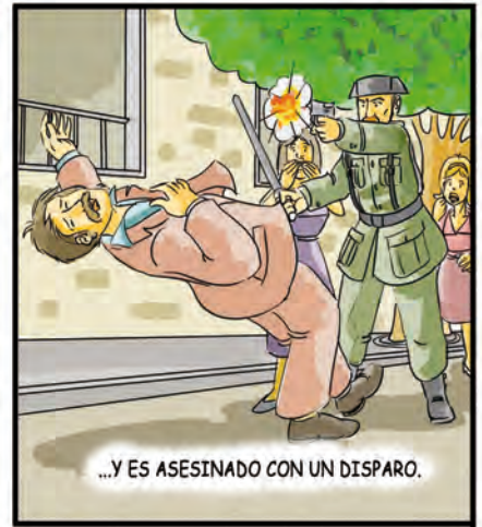
...Y ES ASESINADO CON UN DISPARO.