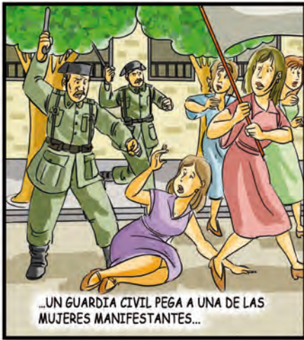
...UN GUARDIA CIVIL PEGA A UNA DE LAS MUJERES MANIFESTANTES...