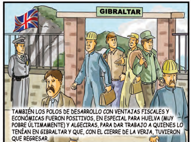
TAMBIÉN LOS POLOS DE DESARROLLO CON VENTAJAS FISCALES Y ECONÓMICAS FUERON POSITIVOS, EN ESPECIAL PARA HUELVA (MUY POBRE ÚLTIMAMENTE) Y ALGECIRAS, PARA DAR TRABAJO A QUIENES LO TENÍAN EN GIBRALTAR Y QUE, CON EL CIERRE DE LA VERJA, TUVIERON QUE REGRESAR.