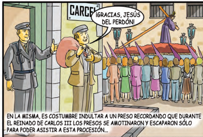
EN LA MISMA, ES COSTUMBRE INDULTAR A UN PRESO RECORDANDO QUE DURANTE EL REINADO DE CARLOS III LOS PRESOS SE AMOTINARON Y ESCAPARON SÓLO PARA PODER ASISTIR A ESTA PROCESIÓN...

LA IMAGINERÍA RELIGIOSA EN TODOS LOS "PASOS", OBRA DE LOS MEJORES ESCULTORES Y TALLISTAS, ES DE UN ARTE EXTRAORDINARIO. AUNQUE ESTAS PROCESIONES SON COMUNES EN TODA ESPAÑA, LAS DE ANDALUCÍA SE HAN HECHO FAMOSAS EN EL MUNDO ENTERO.