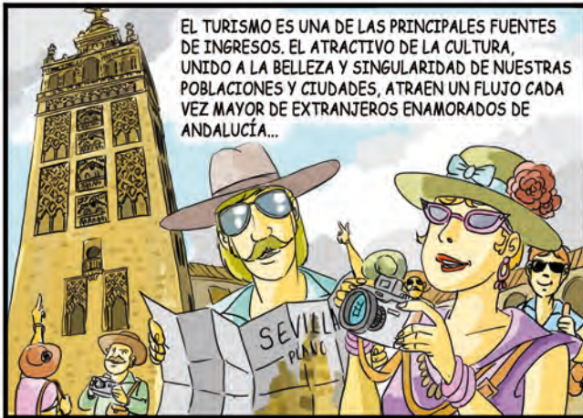
EL TURISMO ES UNA DE LAS PRINCIPALES FUENTES DE INGRESOS. EL ATRACTIVO DE LA CULTURA, UNIDO A LA BELLEZA Y SINGULARIDAD DE NUESTRAS POBLACIONES Y CIUDADES, ATRAEN UN FLUJO CADA VEZ MAYOR DE EXTRANJEROS ENAMORADOS DE ANDALUCÍA...