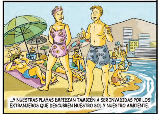
...Y NUESTRAS PLAYAS EMPIEZAN TAMBIÉN A SER INVADIDAS POR LOS EXTRANJEROS QUE DESCUBREN NUESTRO SOL Y NUESTRO AMBIENTE.