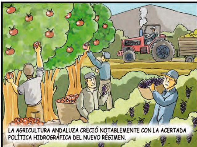
LA AGRICULTURA ANDALUZA CRECIÓ NOTABLEMENTE CON LA ACERTADA POLÍTICA HIDROGRÁFICA DEL NUEVO RÉGIMEN.