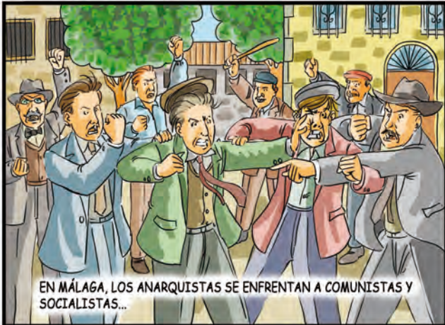
EN MÁLAGA, LOS ANARQUISTAS SE ENFRENTAN A COMUNISTAS Y SOCIALISTAS...