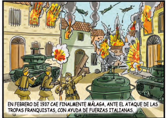
EN FEBRERO DE 1937 CAE FINALMENTE MÁLAGA, ANTE EL ATAQUE DE LAS TROPAS FRANQUISTAS, CON AYUDA DE FUERZAS ITALIANAS.