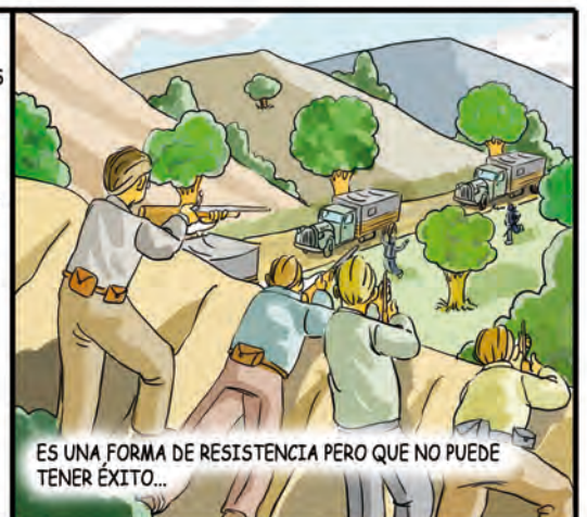
ES UNA FORMA DE RESISTENCIA PERO QUE NO PUEDE TENER ÉXITO...