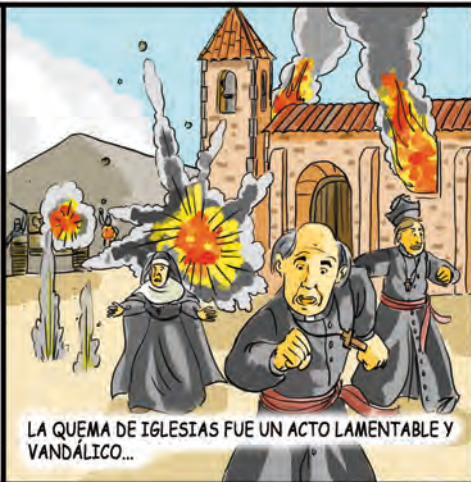
LA QUEMA DE IGLESIAS FUE UN ACTO LAMENTABLE Y VANDÁLICO...