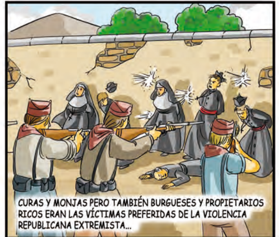
CURAS Y MONJAS PERO TAMBIÉN BURGUESES Y PROPIETARIOS RICOS ERAN LAS VÍCTIMAS PREFERIDAS DE LA VIOLENCIA REPUBLICANA EXTREMISTA...