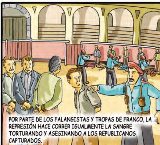
POR PARTE DE LOS FALANGISTAS Y TROPAS DE FRANCO, LA REPRESIÓN HACE CORRER IGUALMENTE LA SANGRE TORTURANDO Y ASESINANDO A LOS REPUBLICANOS CAPTURADOS.