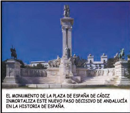
EL MONUMENTO DE LA PLAZA DE ESPAÑA DE CÁDIZ INMORTALIZA ESTE NUEVO PASO DECISIVO DE ANDALUCÍA EN LA HISTORIA DE ESPAÑA.