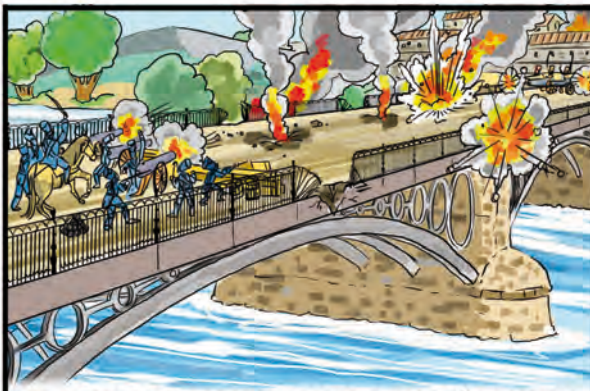
LOS RESTOS DE TROPAS FRANCESAS EN SEVILLA AÚN RESISTEN E INTENTAN COMBATIR EN EL PUENTE DE TRIANA PERO HUIRÁN Y LOS AFRANCESADOS SERÁN DURAMENTE CASTIGADOS.

LOS PROBLEMAS EN SUS DIVERSOS FRENTEROS EN EUROPA Y SU PROPIA SITUACIÓN EN PARÍS OBLIGAN A NAPOLEÓN A DESISTIR DE SU PLAN DE DOMINAR ESPAÑA. FERNANDO VII "EL DESEADO", REGRESA POR FIN A ESPAÑA ENTRE EL ENTUSIASMO POPULAR EL 14 DE MARZO DE 1814.