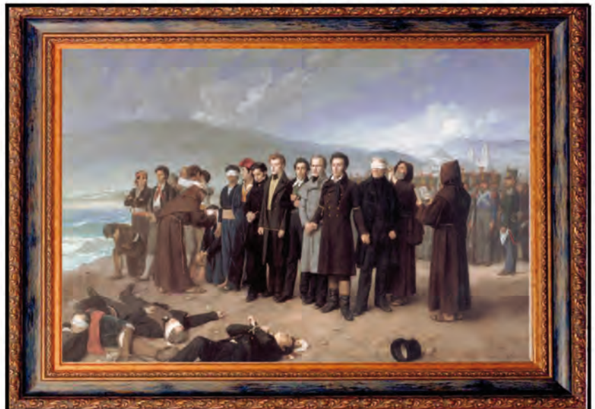
EL 11 DE DICIEMBRE DE 1831, SON FUSILADOS EN LA MALAGUEÑA PLAYA DE SAN ANDRÉS, COMO VEMOS EN EL ÓLEO DE ANTONIO GISBERT, TORRIJOS SE NEGÓ A QUE LE VENDARAN LOS OJOS PARA EL FUSILAMIENTO.